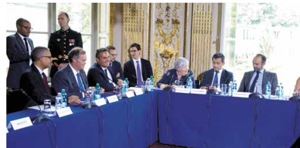
→ Signature du pacte de confiance entre l'État et la Région Réunion en juin 2018