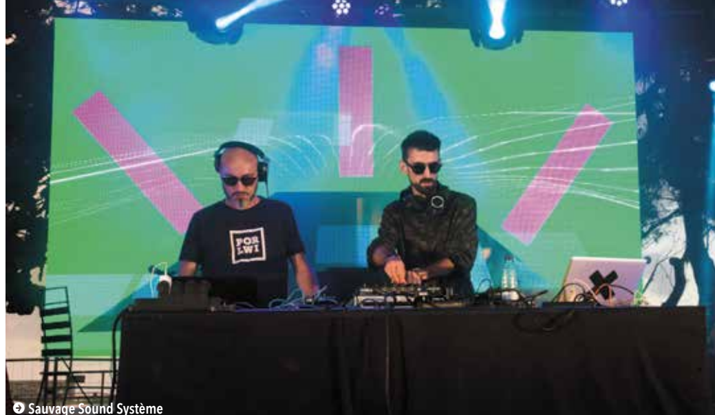
Sauvage Sound Système