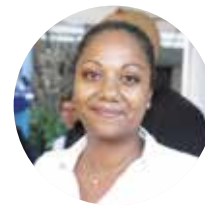
CHRISTELLE Espace Clim et Froid

« Nous sommes spécialisés dans la climatisation, le froid et l'électricité. C'est important pour nous d'être là aujourd'hui, de présenter nos métiers au près des jeunes qui souhaiteraient apprendre et au public. L'artisanat n'est pas un secteur méconnu des Réunionnais, cependant, ils ne vont pas forcément chercher à s'informer plus particulièrement sur nos secteurs d'activité, sur les différentes structures qui existent. »