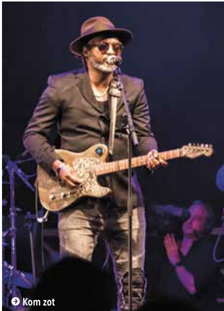
➤ Kom zot