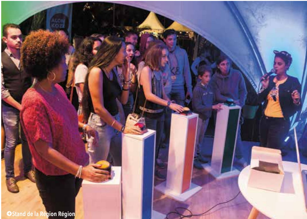
➤ Stand de la Région Réunion