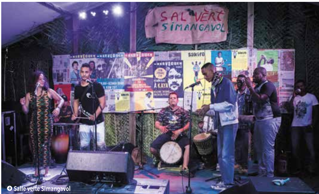
➤ Salle verte Simangavol