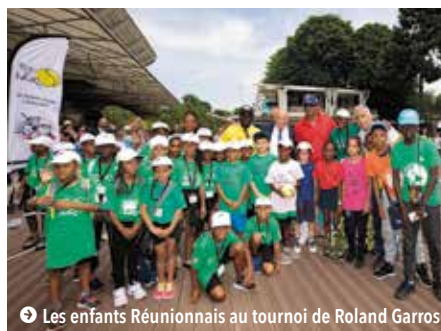
➔ Les enfants Réunionnais au tournoi de Roland Garros

60 enfants réunionnais, membres de l'Association Fête le Mur Réunion, se sont rendus au tournoi de Roland Garros pour participer à la « journée des enfants ». Une journée organisée par Fête le Mur national et la Fédération Française de Tennis (FFT).