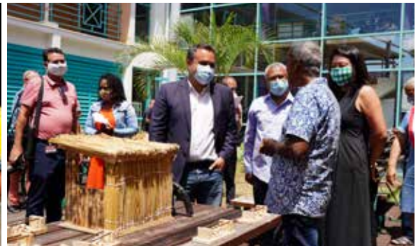
📍 "Lancement de la "Somen Kreol" à la médiathèque de Sainte-Marie

Vivre à La Réunion confère à tous en partage une culture métissée au caractère marqué, une identité forte et plurielle issue de notre histoire et de nos origines européennes, africaines, chinoises, indiennes et d'autres encore. Tout ce qui fonde au final cette singularité réunionnaise à laquelle nous sommes profondément attachés en tant que filles et fils de l'océan Indien, de France et d'Europe ; tout ce qui nous forge un destin commun.