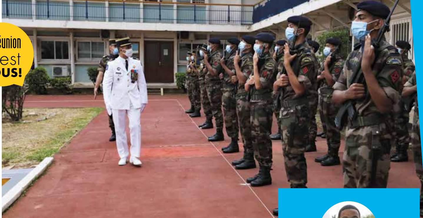
📍 Cérémonie de présentation au Drapeau au quartier Ailleret