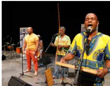
📍 "Village maloya 2020" à Stella

« Je considère que ces moments sont importants, d'autant plus dans la période que nous traversons. Ils symbolisent la réussite chèrement acquise du vivre-ensemble harmonieux que nous connaissons aujourd'hui à La Réunion. »