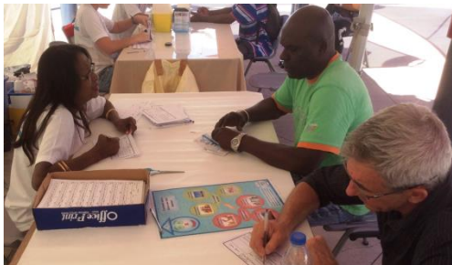
Saint-Denis – 15 juin 2015