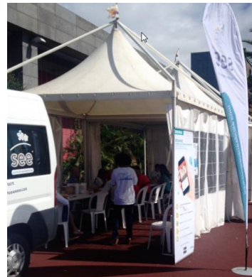
Sainte-Marie – 16 juin 2015