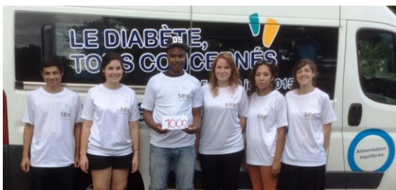
Saint-Leu – 17 juin 2015