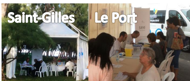
Saint-Gilles et Le Port – 19 juin 2015