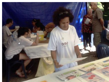
Saint-Pierre – 18 juin 2015